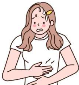
복통 및 설사