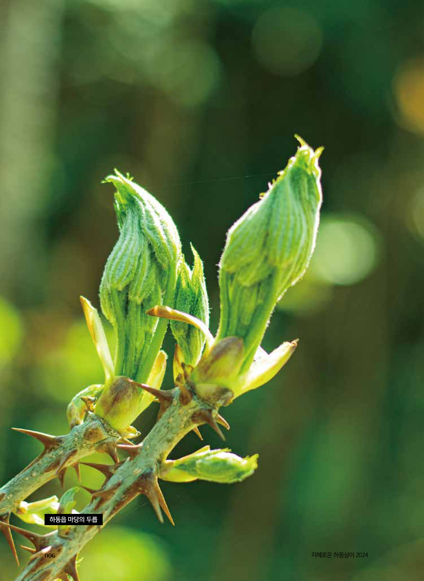
하동읍 마당의 두릅