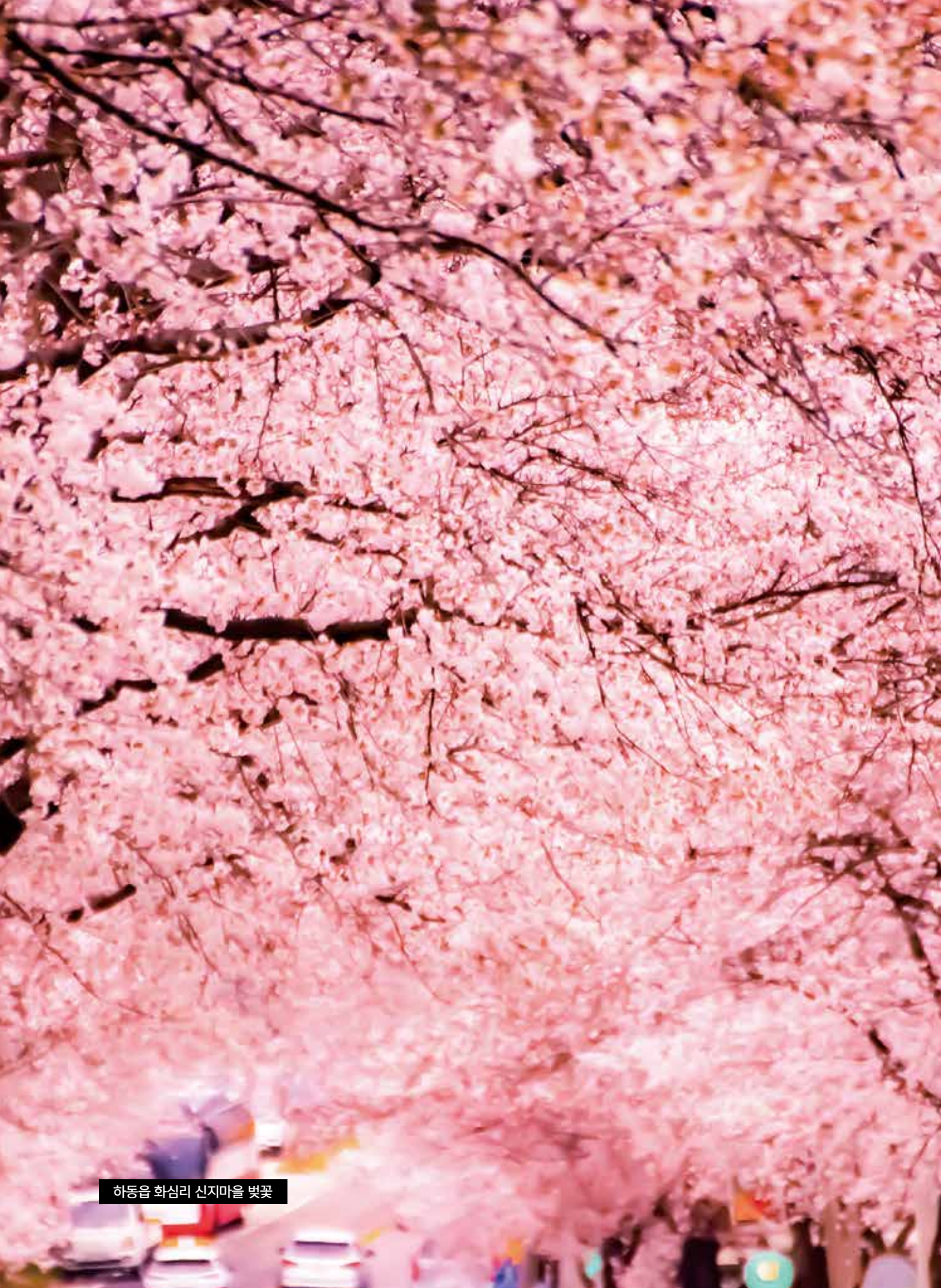
하동읍 화심리 신지마을 벚꽃