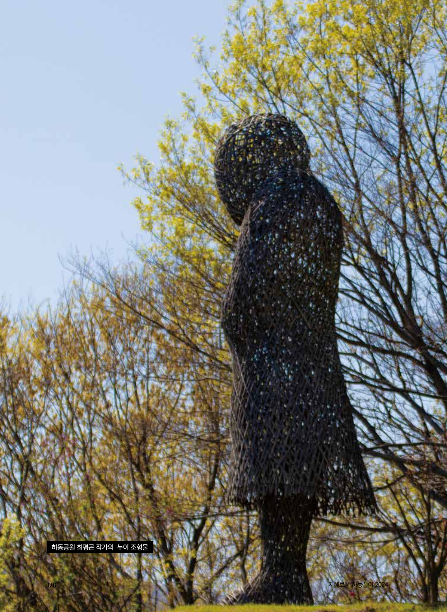
하동공원 최평곤 작가의 누이 조형물